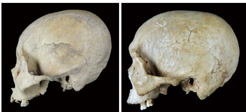
Figura 2. Cráneo aborigen cubano preagroalfarero (izquierda) y cráneo de chino cubano (derecha). Nótese la semejanza anatómica general. Colección Osteológica Museo Antropológico Montané, Universidad de La Habana.

Al observar la Figura 2 que representa un cráneo aborigen cubano preagroalfarero y otro mongoloide actual, ambos en vista lateral, notamos un parecido extraordinario y esto está relacionado con el origen asiático de los primeros pobladores de América, que posteriormente llegaron al Caribe.