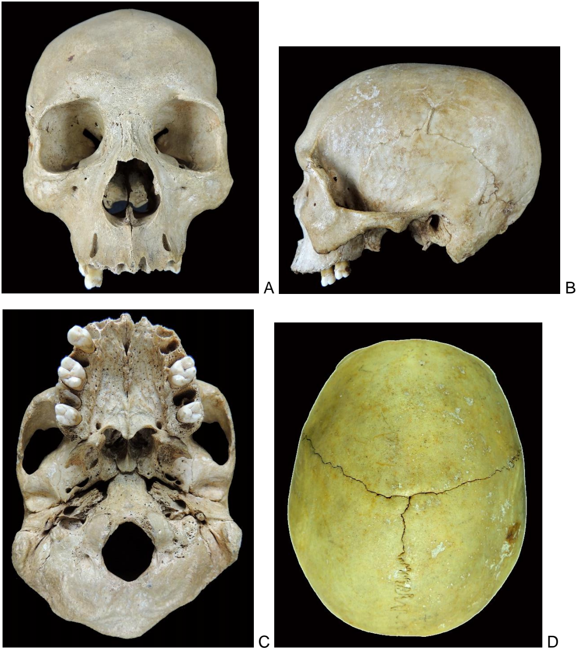
Figura 1. Fotografías en cuatro vistas del cráneo mongoloide donde pueden apreciarse los caracteres típicos de este fenotipo. A (vista frontal), B (vista lateral), C (vista ventral) y D (vista superior)